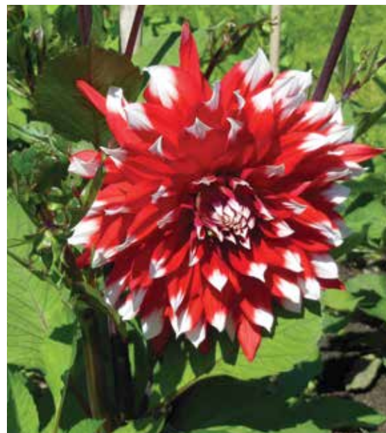
Dahlian älskar sol, bördig jord och vill ha vatten regelbundet. Växter som är rätt planterade drabbas mer sällan av ohyra.

Funkian trivs i skugga-halvskugga, men marken bör vara väl-dränerad. Är den konstant fuktig ökar risken för snigelangrepp.