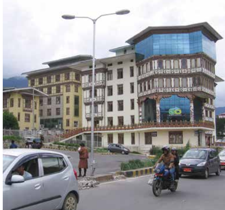
En modern bilpark, mobiltelefoner, samt glas och betong i kombination med traditionell arkitektur dominerar gatubilden i Thimpu.

naturen lyder målsättningen. Men vi är inne i ett nytt utvecklingsskede i fråga om det berömda lyckoindexet. Grundprinciperna förblir dock de samma, säger Thoki Zangmo vid det bhutanesiska forskningsinstitutet för lycka.