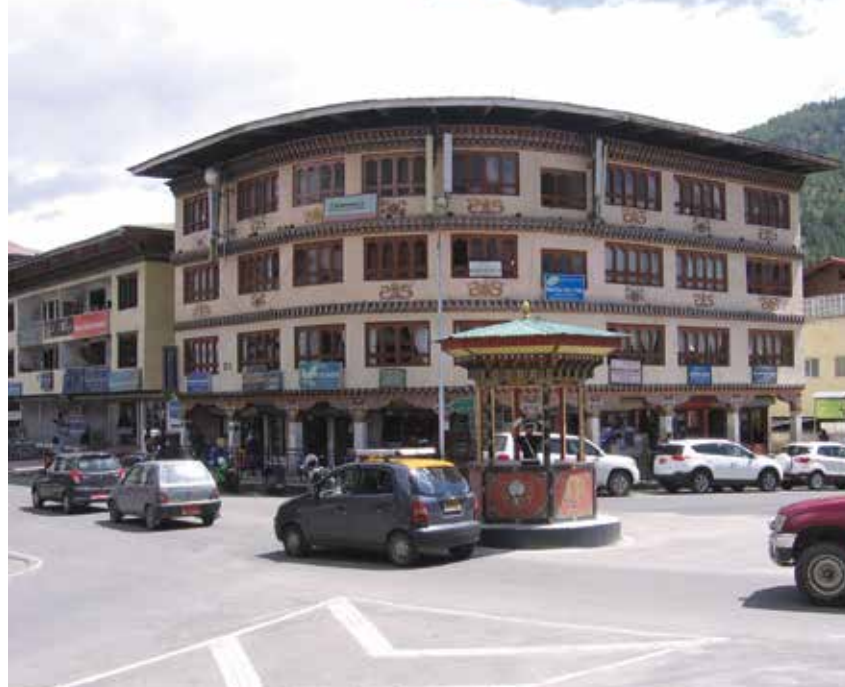
En kort tid hade man trafikljus i huvudstaden Thimpu. De ersattes dock snart av en trafikpolis.