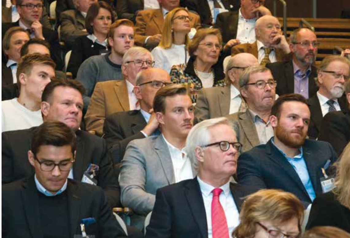
Publiken lyssnade engagerat till paneldeltagarnas rappa repliker.