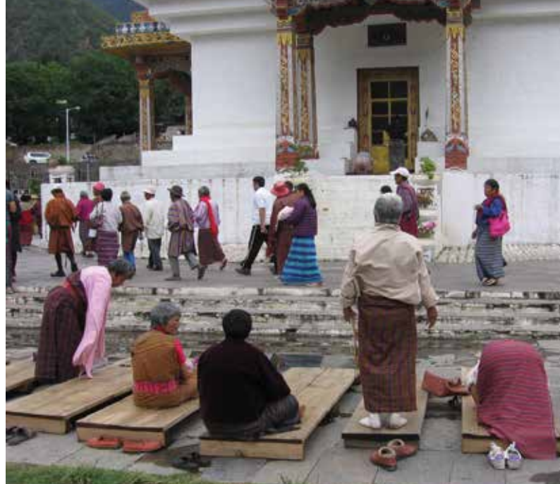
Bedjande bhutaneser i ett buddhistiskt tempel.